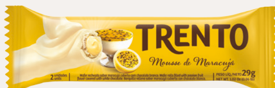
Trento Mousse de Maracujá (Mousse de Maracujá) Cód. 90250 (8dsps - 464g)