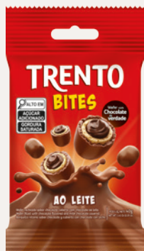
Trento Bites Ao Leite (Ao Leite) Cód. 91141 (8dsps - 480g)