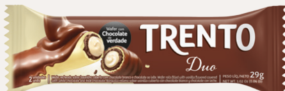
Trento Duo (Duo) Cód. 90247 (8dsps - 464g)