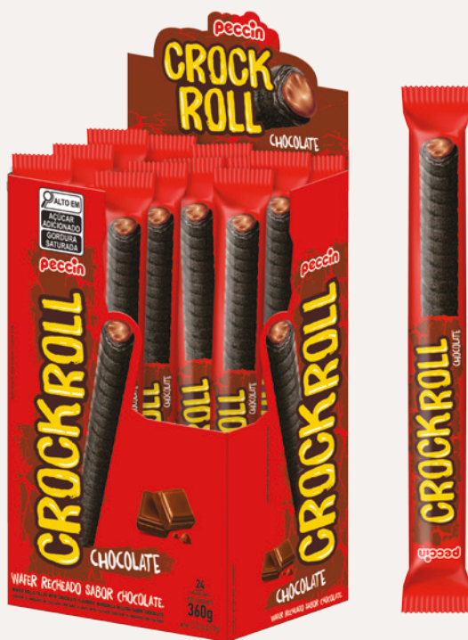
Crockroll Chocolate (Chocolate) Cód. 90323 (8dsps - 360g)