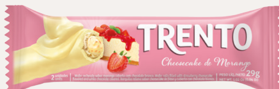
Trento Cheesecake de Morango (Cheesecake de Morango) Cód. 90243 (8dsps - 464g)