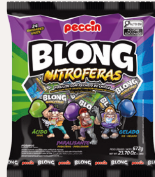
Blong Nitroferas (Morango) Cód. 90223 (12pcts - 672g)