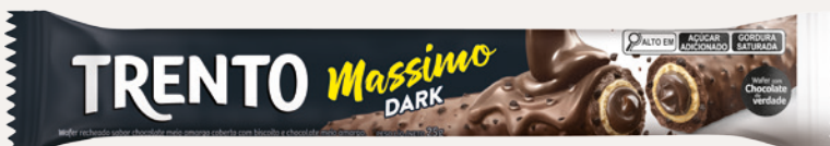
Trento Massimo Dark (Dark) Cód. 90236 (8dsps - 375g)