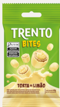
Trento Bites Torta de Limão (Torta de Limão) Cód. 91129 (8dsps - 480g)