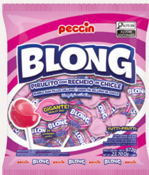
Blong Tutti - Frutti (Tutti - Frutti) Cód. 99158 (12pcts - 672g)