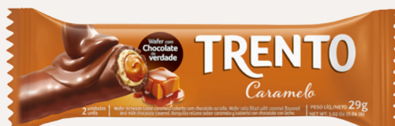
Trento Caramelo (Caramelo) Cód. 90258 (8dsps - 464g)