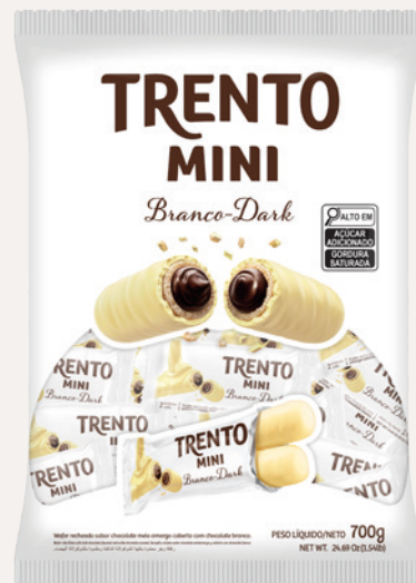
Trento Mini Branco-Dark (Branco-Dark) Cód. 90294 (6pcts - 700g)