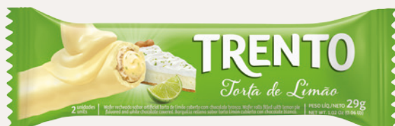
Trento Torta de Limão (Torta de Limão) Cód. 90251 (8dsps - 464g)