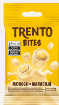
Trento Bites Mousse de Maracujá (Mousse de Maracujá) Cód. 92883 (8dsps - 480g)