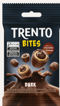
Trento Bites Dark (Dark) Cód. 91142 (8dsps - 480g)