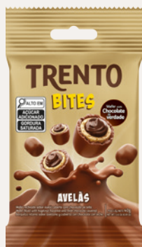
Trento Bites Avelãs (Avelãs) Cód. 90113 (8dsps - 480g)