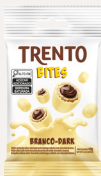
Trento Bites Branco-Dark (Branco-Dark) Cód. 91127 (8dsps - 480g)