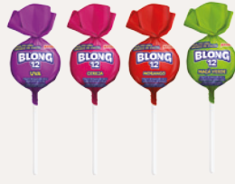
Blong 12 Sortido (Uva, Cereja, Morango e Maçã Verde) Cód. 99478 (16pcts - 600g)