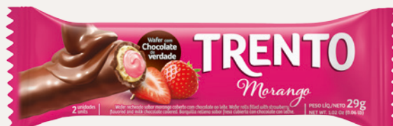
Trento Morango (Morango) Cód. 90249 (8dsps - 464g)