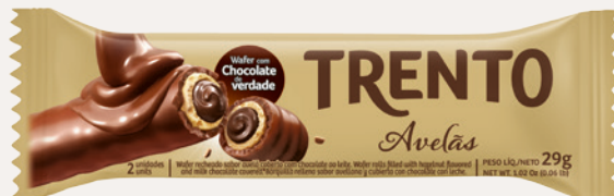
Trento Avelãs (Avelãs) Cód. 90242 (8dsps - 464g)