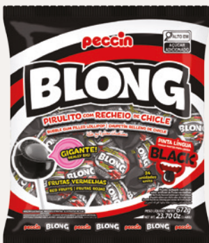
Blong Black (Frutas Vermelhas) Cód. 99828 (12pcts - 672g)