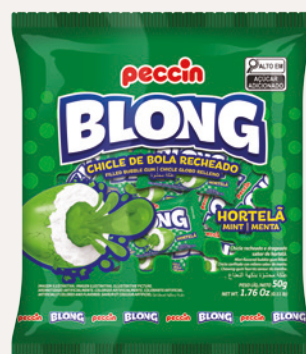
Blong Hortelã (Hortelã) Cód. 99017 (32pcts - 50g)