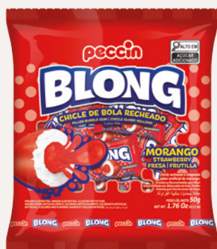
Blong Morango (Morango) Cód. 99018 (32pcts - 50g)