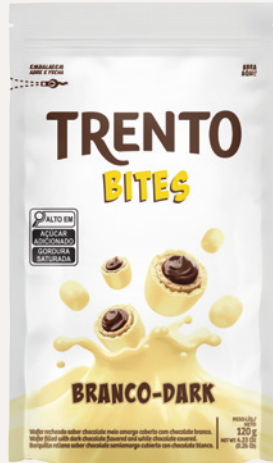
Trento Bites Branco-Dark (Branco-Dark) Cód. 91139 (20unid - 120g)