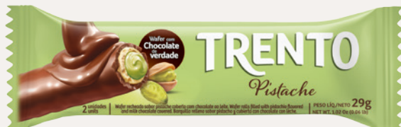
Trento Pistache (Pistache) Cód. 90292 (8dsps - 464g)