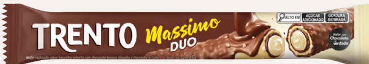
Trento Massimo Duo (Duo) Cód. 90237 (8dsps - 375g)