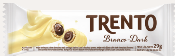
Trento Branco-Dark (Branco-Dark) Cód. 90245 (8dsps - 464g)