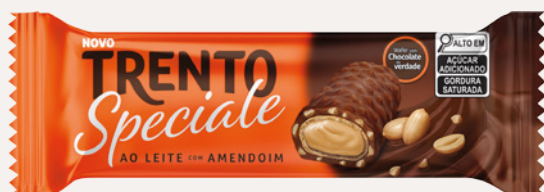
Trento Speciale Ao Leite com Amendoim (Ao Leite com Amendoim) Cód. 90327 (8dsps - 416g)