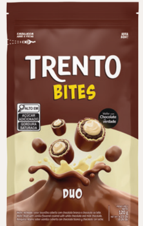
Trento Bites Duo (Duo) Cód. 90055 (20unid - 120g)