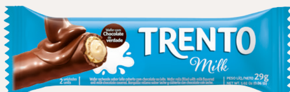
Trento Milk (Milk) Cód. 90248 (8dsps - 464g)