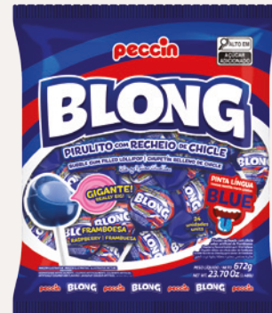
Blong Blue (Framboesa) Cód. 99824 (12pcts - 672g)