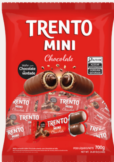
Trento Mini Chocolate (Chocolate) Cód. 90295 (6pcts - 700g)