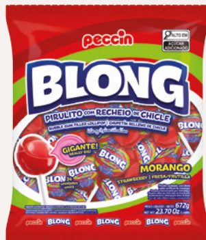
Blong Morango (Morango) Cód. 99157 (12pcts - 672g)