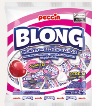
Blong Cereja (Cereja) Cód. 99257 (12pcts - 672g)