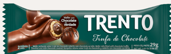
Trento Trufa de Chocolate (Trufa de Chocolate) Cód. 90253 (8dsps - 464g)