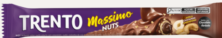
Trento Massimo Nuts (Nuts) Cód. 90239 (8dsps - 375g)