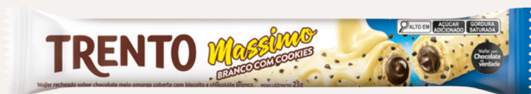
Trento Massimo Branco com Cookies (Branco com Cookies) Cód. 90233 (8dsps - 375g)