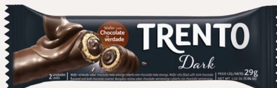
Trento Dark (Dark) Cód. 90246 (8dsps - 464g)