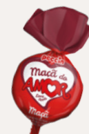
Maçã do Amor (Maçã) Cód. 99984 (32pcts - 120g) Cód. 99602 (16pcts - 480g)