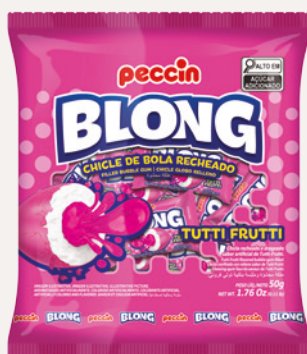
Blong Tutti - Frutti (Tutti - Frutti) Cód. 99019 (32pcts - 50g)