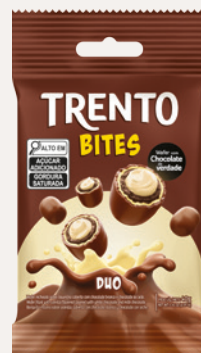
Trento Bites Duo (Duo) Cód. 90054 (8dsps - 480g)