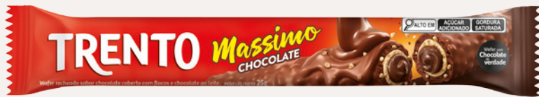
Trento Massimo Chocolate (Chocolate) Cód. 90235 (8dsps - 375g)