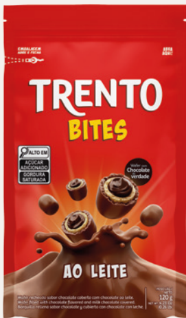
Trento Bites Ao Leite (Ao Leite) Cód. 91140 (20unid - 120g)