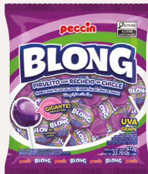
Blong Uva (Uva) Cód. 99159 (12pcts - 672g)