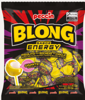
Blong Energy (Framboesa com Abacaxi) Cód. 91489 (12pcts - 672g)