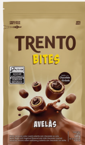
Trento Bites Avelãs (Avelãs) Cód. 90112 (20unid - 120g)