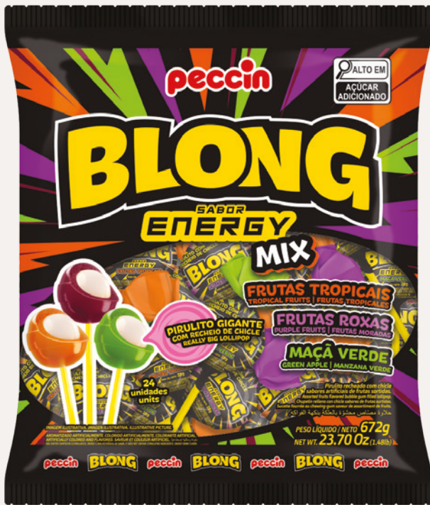
Blong Energy Mix (Frutas Tropicais, Frutas Roxas, Maçã Verde) Cód. 90142 (12pcts - 672g)