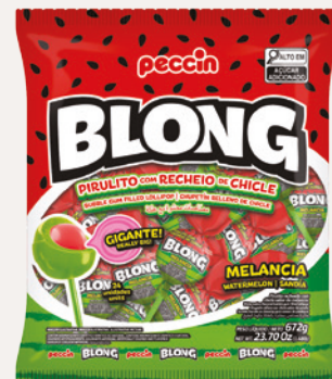
Blong Melancia (Melancia) Cód. 90110 (12pcts - 672g)