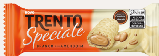
Trento Speciale Branco com Amendoim (Chocolate Branco com Amendoim) Cód. 90328 (8dsps - 416g)