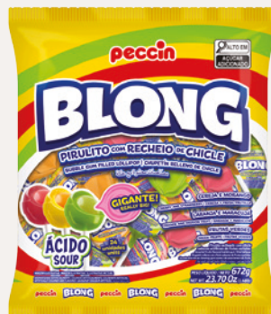
Blong Sour Sortido (Cereja e Morango, Frutas Verdes, Laranja e Maracujá) Cód. 99943 (12pcts - 672g)